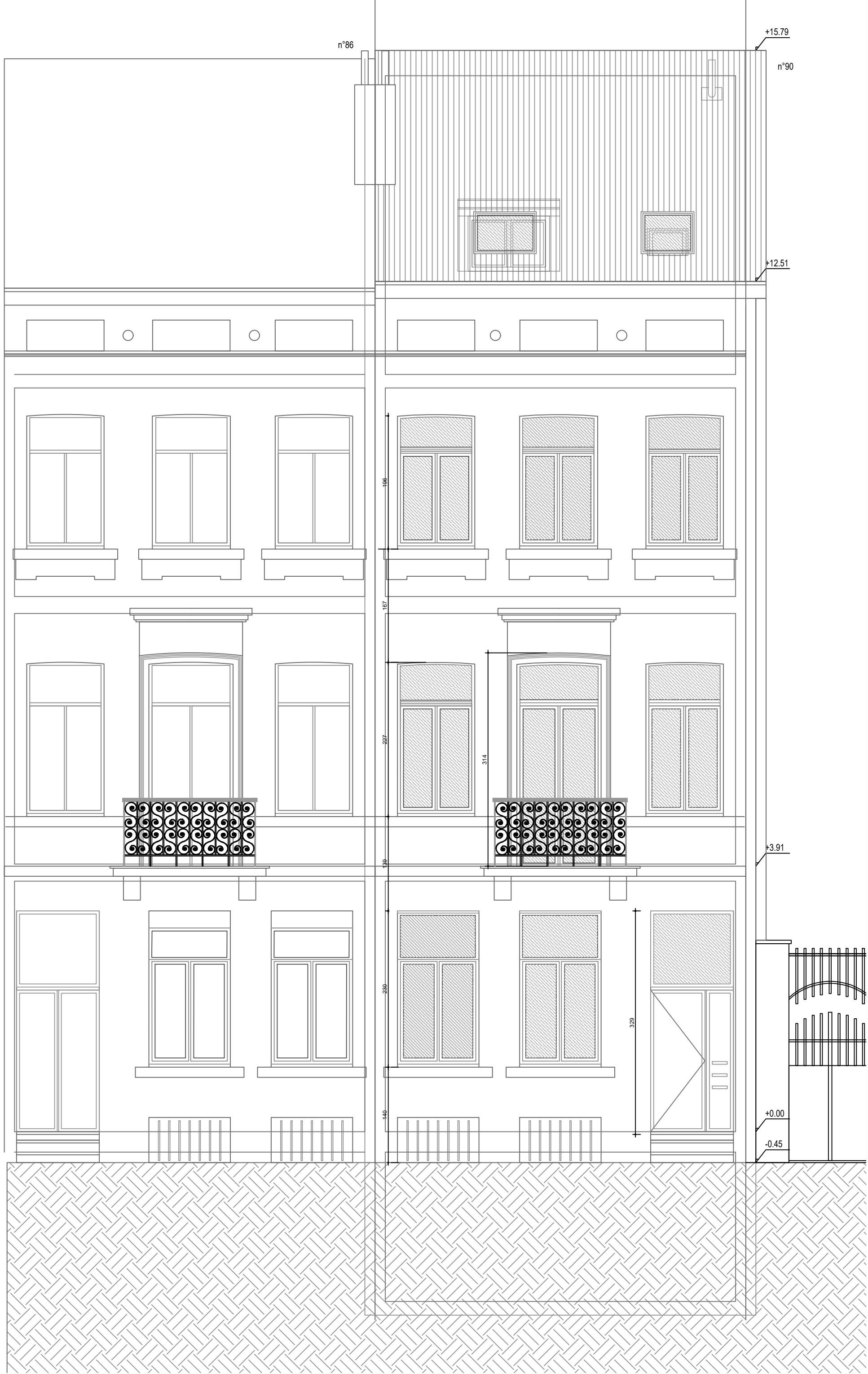
Façade avant projetée - 1/50